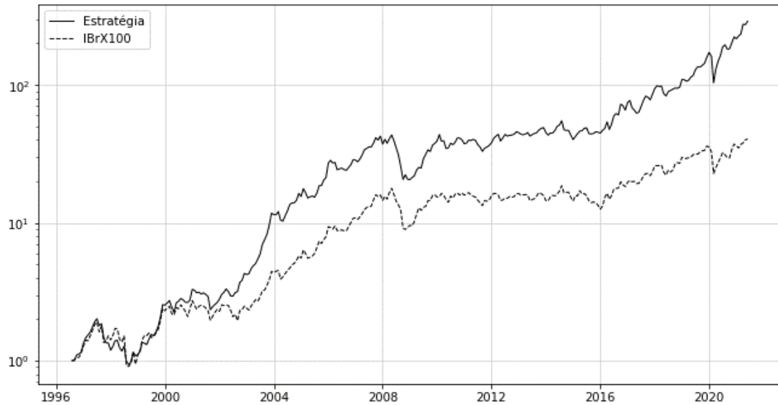
Figura 2. Evolução de R$1 investido em momentum long-only ( f=6, p=3 ) vs. IBrx100

A Figura 2 mostra a evolução do capital investido na estratégia de momentum de maior geração de alpha, em sua versão long-only . Foi utilizado o período de formação de seis meses, e três meses de permanência.