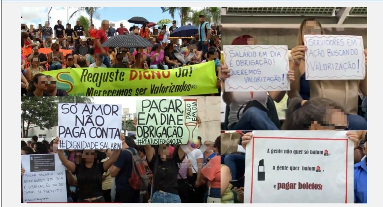
Figura 4 - Cartazes e palavras de ordem dos servidores durante a greve de 2024