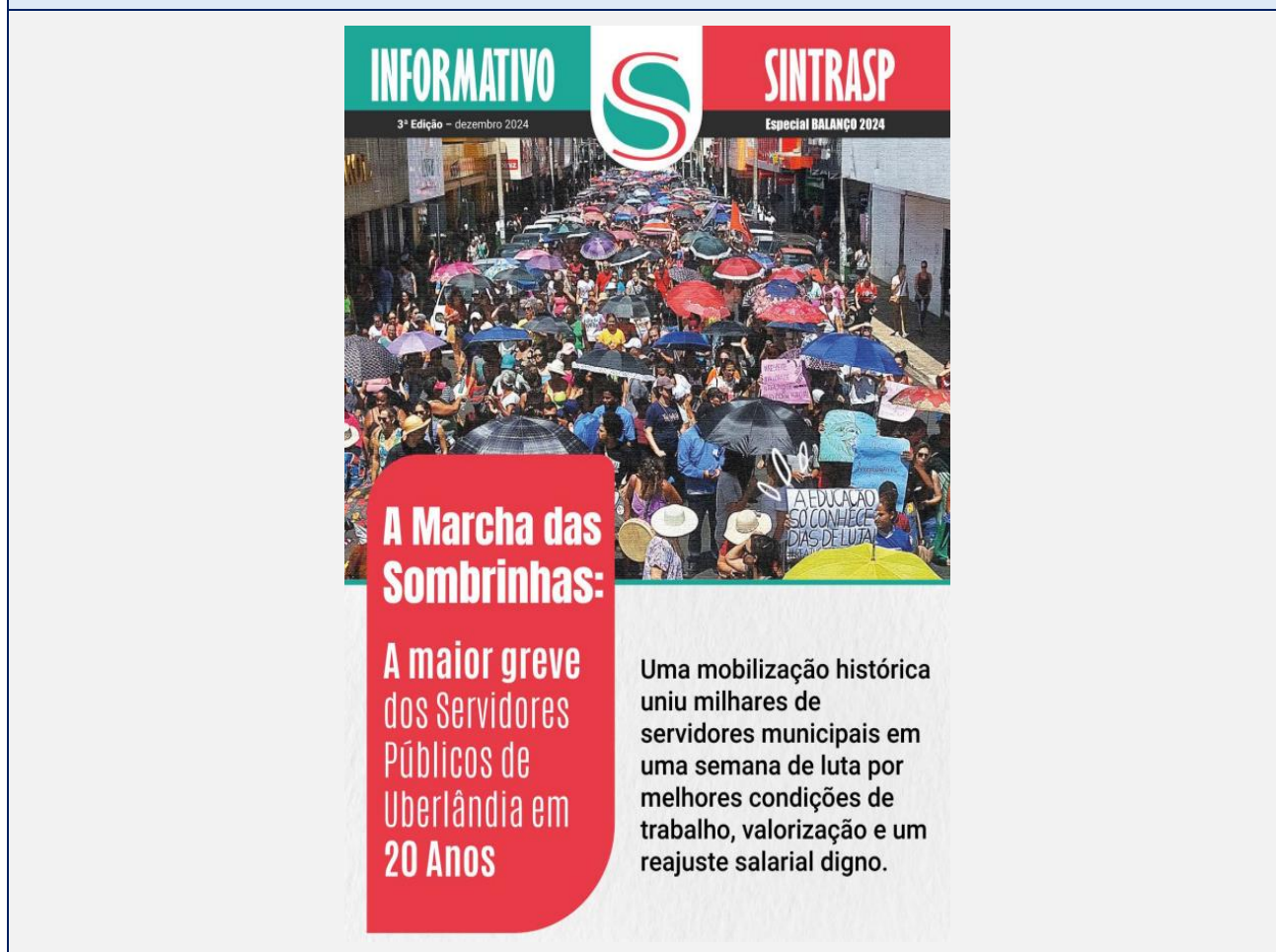
Figura 3 – Capa do informativo especial divulgado pelo SINTRASP, com destaque para a “Marcha das Sombrinhas” como símbolo da mobilização grevista