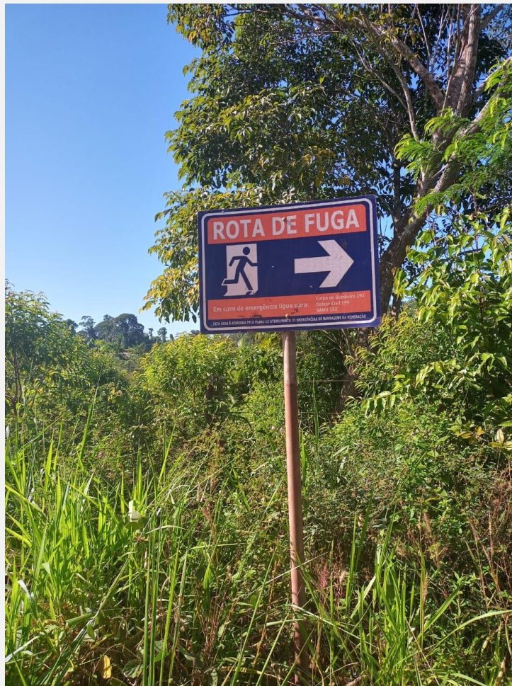
Figura 2 - Placa de orientação para caso de rompimento de barragem de rejeito minerária localizada na APA do Igarapé Gelado, em Parauapebas, Pará