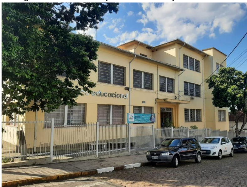
Figura 1: Fachada do prédio da Fundação Educacional

Seguem fotos de alguns monumentos expostos no interior da unidade escolar, que nos fornece informações do período de sua fundação e início de funcionamento.