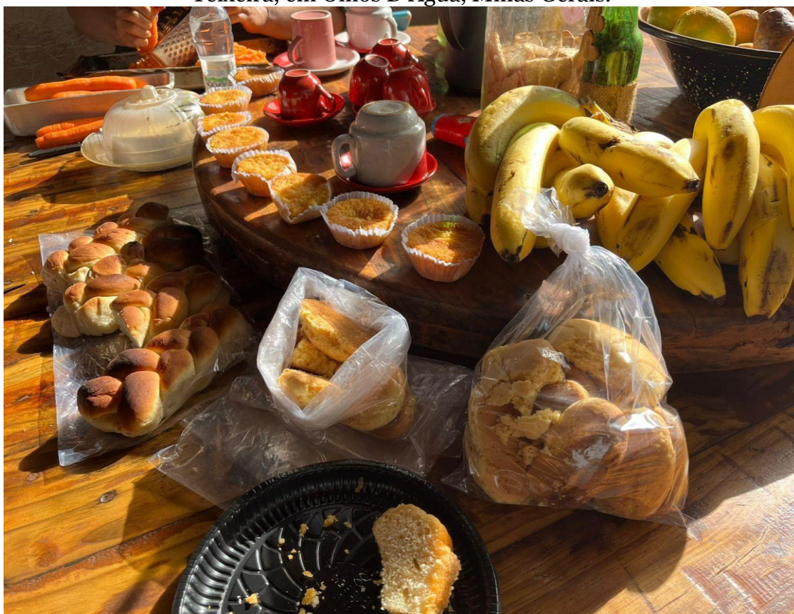
Figura 5 - Quitandas produzidas pelas mulheres do acampamento João Pedro Teixeira, em Olhos D'Água, Minas Gerais.

No campo produtivo, o cultivo de alimentos, a produção de quitandas e outros produtos (Figura 4), se destacam como atividades essenciais e basilares para a região, que garante a geração de renda e a segurança alimentar das famílias. Essas práticas revelam a capacidade das mulheres em articular trabalho produtivo com reprodutivo, afirmando-se como figuras fundamentais, mesmo que historicamente integram posições subalternas em uma sociedade “capitalista, patriarcal de supremacia branca” (HOOKS, 2018). Especialmente nas dinâmicas das ruralidades que envolvem dimensões materiais, morais e afetivas, são resistência na luta por criar estratégias para enfrentar estruturas patriarcais. Quando alinhadas à educação libertadora na práxis , essas estratégias constituem ferramentas capazes de envolver de fato e dar voz às classes subalternizadas.