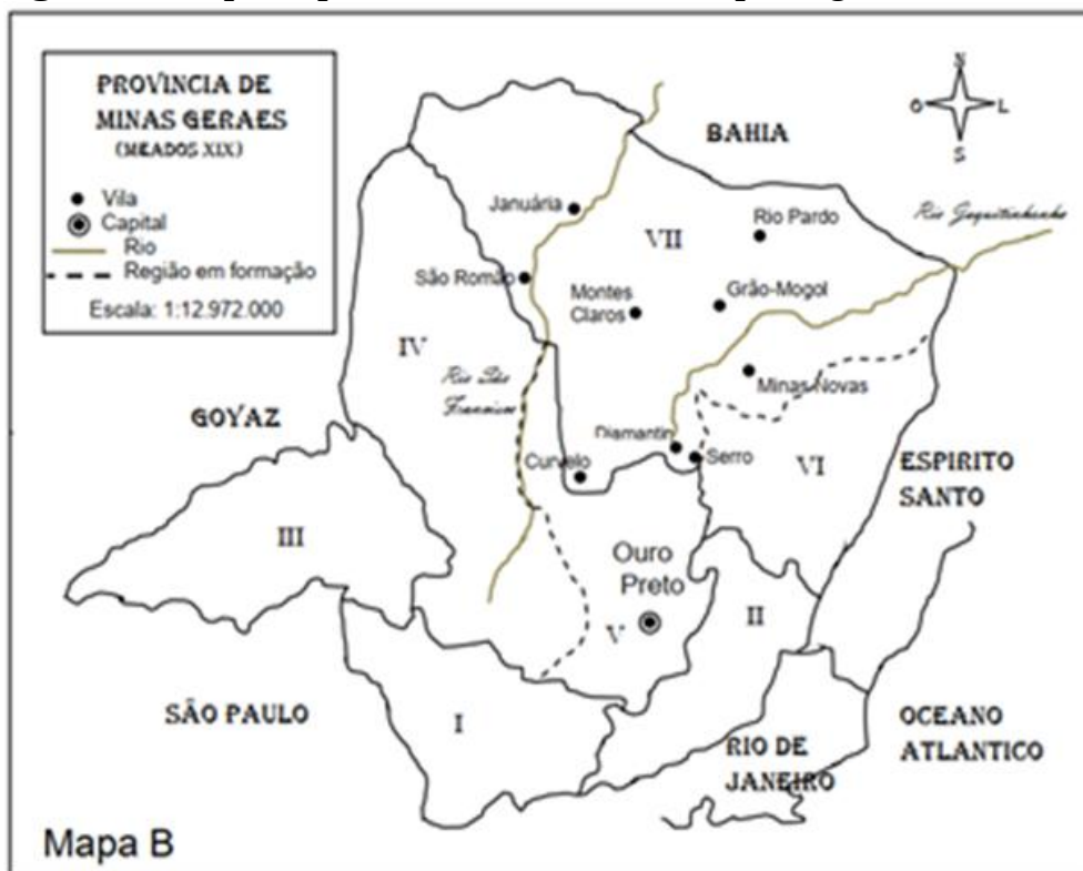
Figura 1 - Mapa da província de Minas Gerais por regiões (século XIX)

Entre essas incursões coloniais e o mapa das províncias de Minas Gerais (Figura 01), registro do início do século XIX, se passam quase 300 anos, que foram marcados pelo genocídio dos povos indígenas, pela expropriação das gentes, terras e bens comuns com a instalação de fazendas de gado e vilarejos em locais estratégicos das rotas que conectavam o sertão e seus rios ao mundo. Os povos indígenas eram os Jê, ou denominados pelo colonizador como Tapuias e Caiapós, os Mongoiós e Pataxós. (AEDAS, 2021).