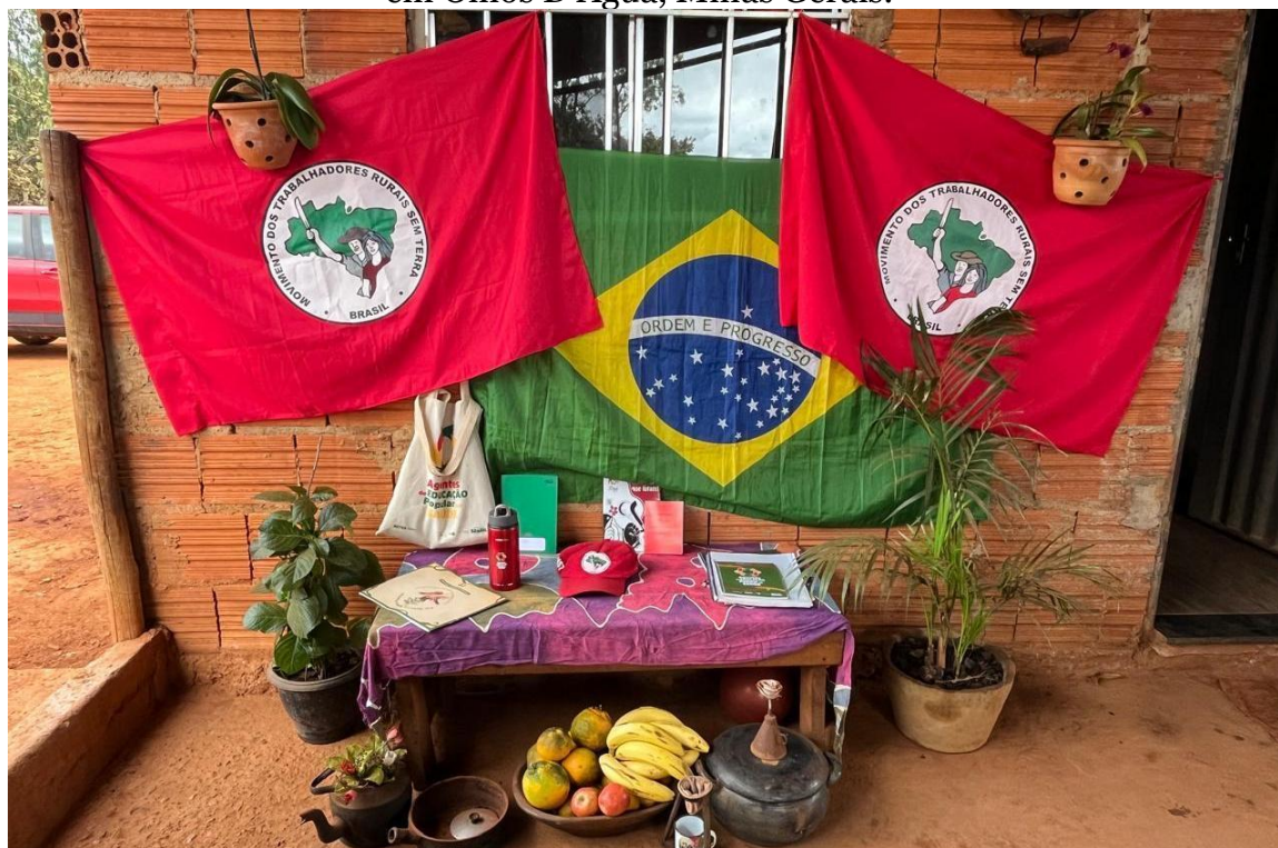
Figura 3 - Mística 9 de preparação do espaço para realização da atividade de formação de Agentes Populares de Saúde no acampamento João Pedro Teixeira, em Olhos D'Água, Minas Gerais.