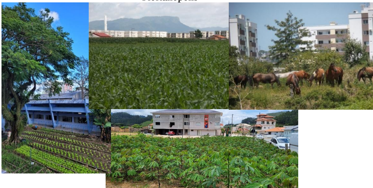
Figura 1 – Áreas de intensa produção agrícola e pecuária na área conurbada de Florianópolis

As atividades práticas em campo ocorreram nas propriedades agrícolas familiares localizadas nas áreas urbanas dos municípios de Florianópolis, São José, Palhoça, Biguaçu e Santo Amaro da Imperatriz, pois são os municípios que compõem o objeto de estudo e que perfazem, hoje, em seu meio urbano, uma única malha advinda da expansão de Florianópolis; de modo a compreender a dinâmica da produção de alimentos, sua comercialização e ao mesmo tempo o processo de urbanização em direção às áreas agrícolas.