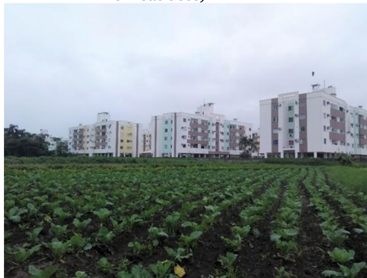
Figura 2 - Produção de hortaliças de pequeno porte (Bairro Sertão do Maruim em São José)

A área conurbada de Florianópolis talvez se comporte de forma díspar a outros municípios catarinenses, e até mesmo brasileiros, os quais apresentam uma produção agrícola em declínio em seu meio urbano. Pois, mesmo sob intensa expansão do perímetro urbano e crescimento da atividade de especulação imobiliária, a produtividade agrícola nos municípios tem se mantido constante. Isto ocorre em Florianópolis, mas é igualmente marcante em outros municípios da conurbação, como São José, onde a agricultura urbana é notável em alguns bairros (antes áreas predominantemente rurais), com uma importante tendência à agricultura orgânica, como pode ser observado na figura 2 a seguir: