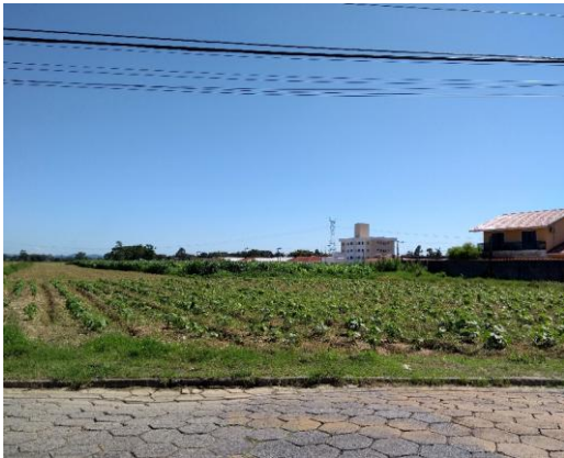
Figura 3 - Produção de hortaliças de pequeno porte; Figura 4 - Produção de Quiabo