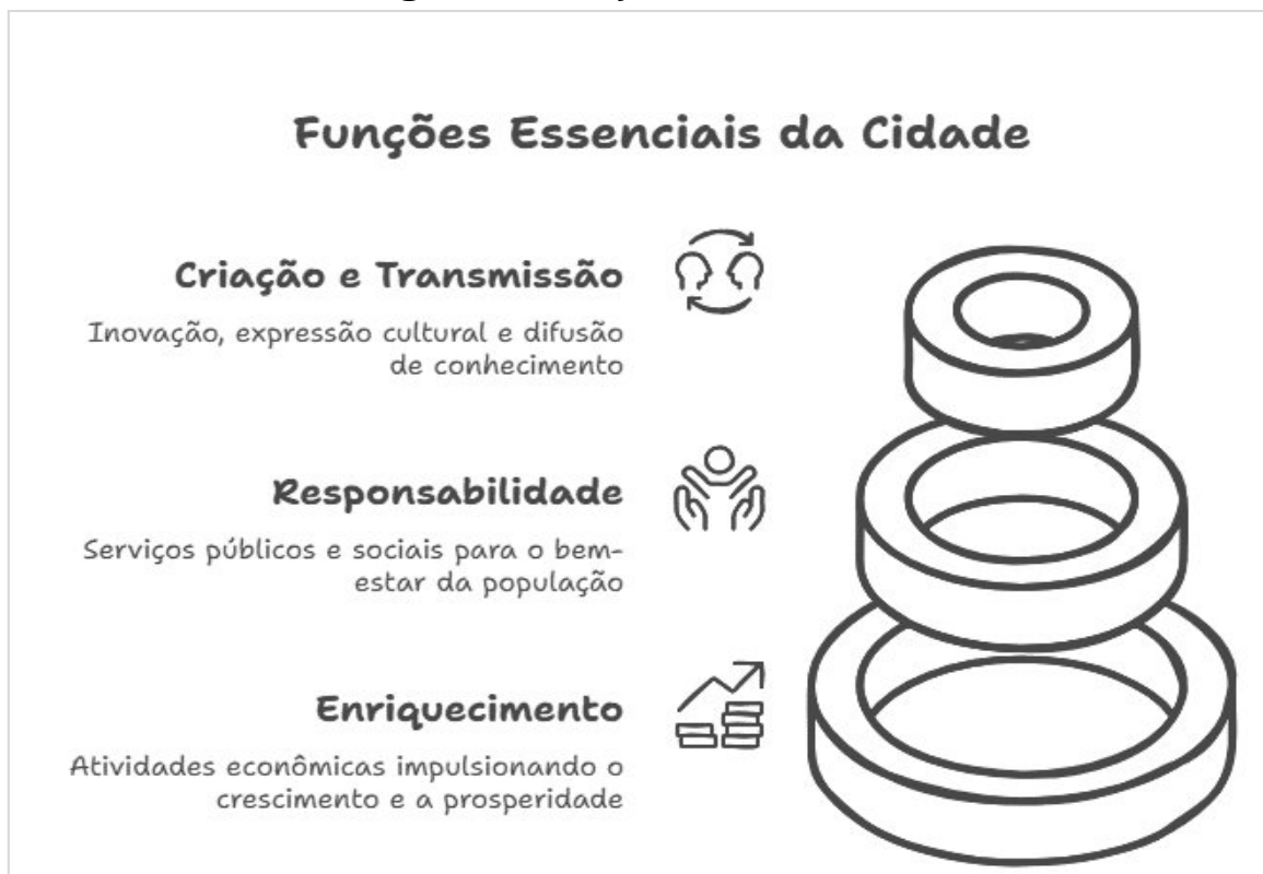
Figura 1 – Funções essenciais da cidade

Fonte: Elaborado pelo autor com base em Beaujeu-Garnier (1980).