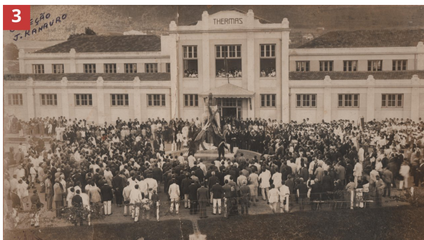
Figura 3 – Thermas Primitiva , resultado de obras no centro de Poços de Caldas, em sua inauguração oficial no dia 27 de abril de 1919.

Fonte: coleção José Ranauro, acervo do Museu Histórico e Geográfico de Poços de Caldas. Referência no acervo: JR46.