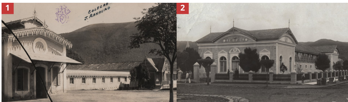
Figura 1 – Balneário Pedro Botelho, primeira casa de banhos de Poços de Caldas, em fotografia do ano de 1920; Figura 2 – Balneário dos Macacos, a segunda casa de banhos da cidade. Ambos atenderam a demanda dos veranistas ao oferecerem a infraestrutura necessária para os banhos.

Referência no acervo: JRO5 (figura 1) e JR52 (figura 2).