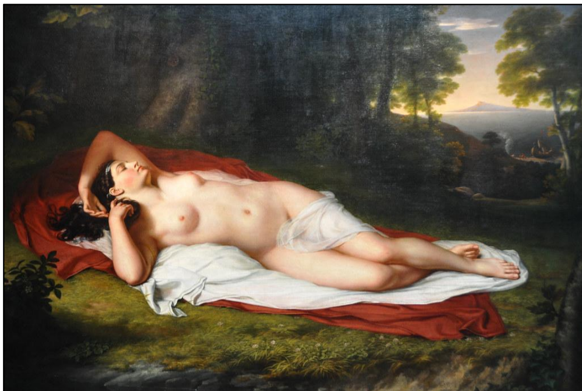
Figura 3 - Ariadne Asleep on the Isle of Naxos

Vanderlyn, John. Ariadne Asleep on the Isle of Naxos . 1809-1814. Óleo sobre tela, 224 x 175 cm. Pennsylvania academy of fine arts, Philadelphia.