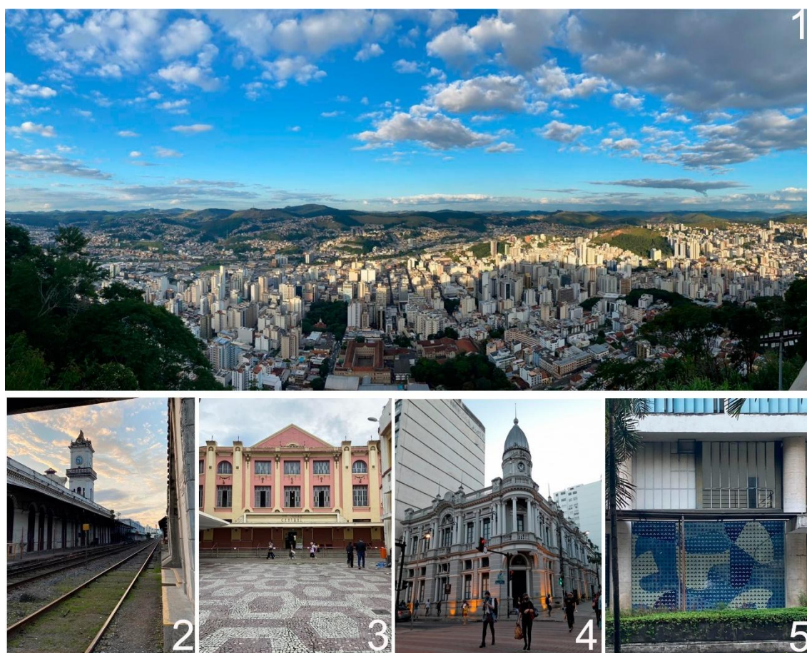
Figura 5 – Imagens de Juiz de Fora

Foto 1: Mirante do Morro do Cristo; Foto 2: Torre da estação central; Foto 3: Cine-Theatro Central; Foto 4: Paço Municipal; Foto 5: Painel do Cândido Portinari.