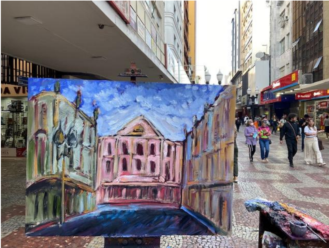
Figura 8 – Cine-Theatro Central pelas mãos de Carlos Bracher, pintor e escultor brasileiro