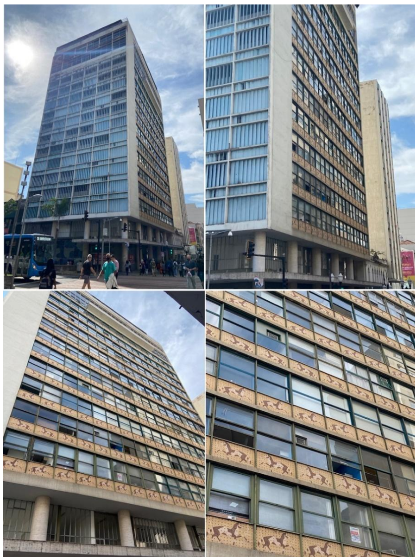
Figura 7 – Edifício Clube Juiz de Fora com o painel “As quatro estações”, no hall, e o mosaico com tema “Cavalos”, em sua fachada