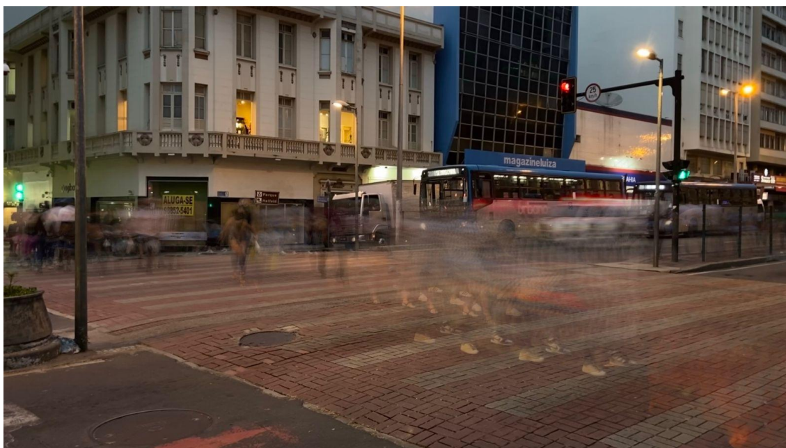
Figura 9 – O movimento da cidade observado do início do calçada da rua Halfeld