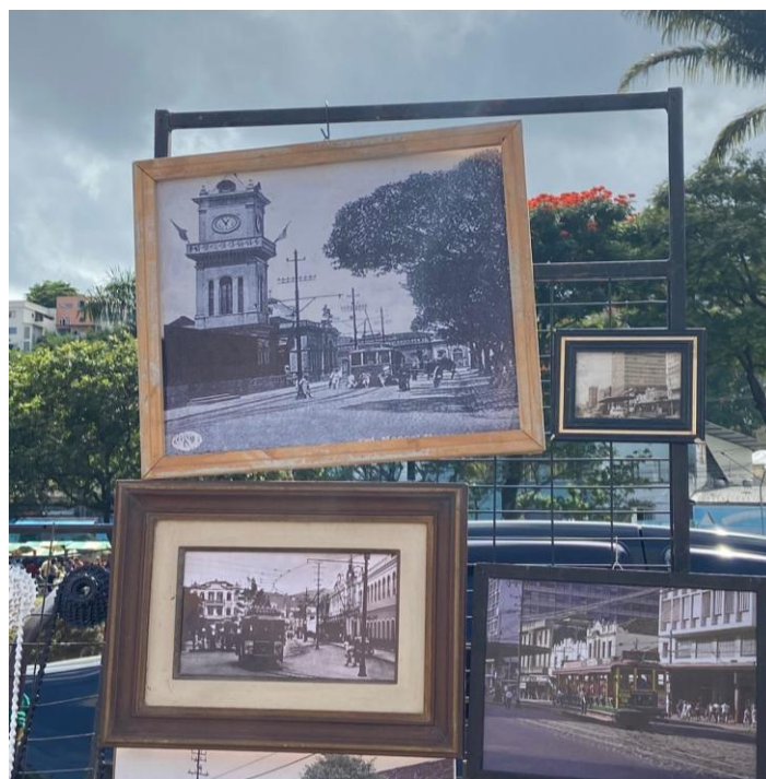
Figura 6 – Quadro da Estação Ferroviária Central exposto na feira livre da Av. Brasil

João Penido, popularmente conhecida como Praça da Estação. Em Juiz de Fora, esse ponto carrega muitas histórias e memórias, daqueles que chegam e daqueles que partem, por essas e outras razões aparece em quadros e em antigos cartões postais (Figuras 6).