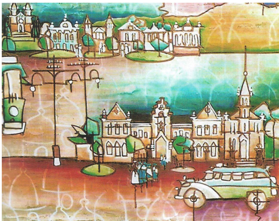
Figura 4 – Avenida Rio Branco, 120x80 cm