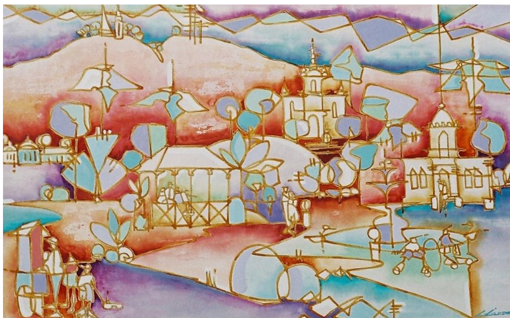
Figura 3 – Tela Parque Halfeld, 120x70 cm