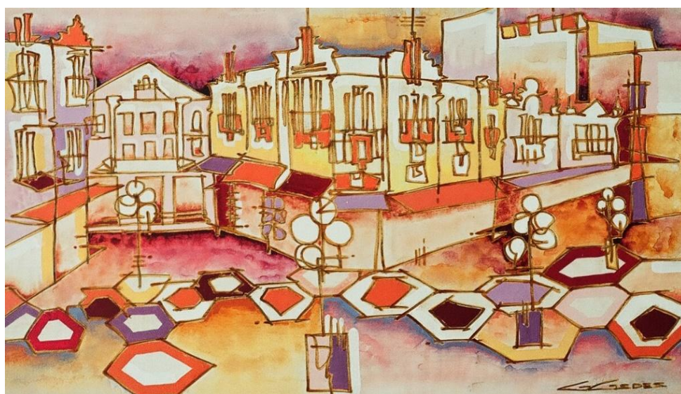
Figura 2 – Tela Calçadão, 140x70 cm.

Halfeld, Onde todos se veem, onde tudo se vê, compra-se ouro, vende-se qualquer coisa. Estátuas humanas, ambulantes, violeiros, D. Marias... Tipos folclóricos renováveis [...] (Guedes, 2012, p. 96-97).