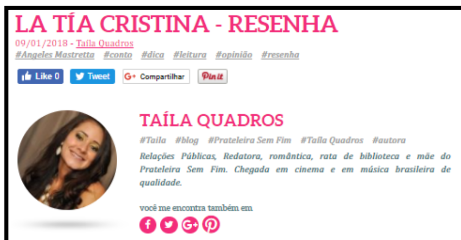
FIGURA 1 – DECLARAÇÕES DE AUTORIA DO TEXTO “LA TÍA CRISTINA – RESENHA”

No blog Prateleira sem fim , a declaração de autoria da obra aparece em dois locais diferentes, conforme visto na figura 1.