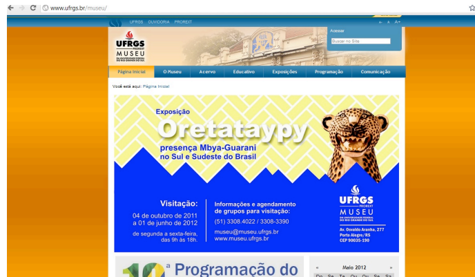
Fig. 1: Homepage do Museu da Universidade Federal do Rio Grande do Sul - UFRGS