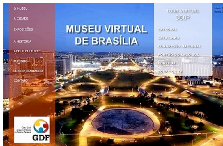
Fig. 2: Homepage do Museu da Universidade Federal de Brasília - UnB