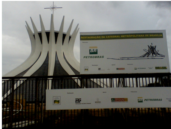
Fig. 3: Catedral Metropolitana de Brasília em processo de restauração.

Essas ações têm sido especialmente importantes não apenas para a divulgação do espaço físico, mas, sobretudo, nos momentos em que este se encontra interditado para visitação em função de algum processo de restauração, como o que aconteceu em 2012.